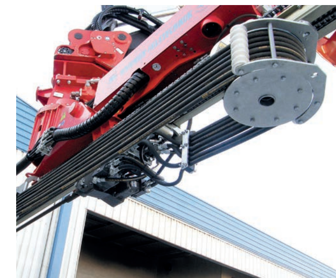
Enrouleur de flexible