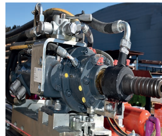
Eurodrill WHD 1002