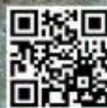
Vidéo SUG 20 Mini-niveleuse & SBV 80 HC 2