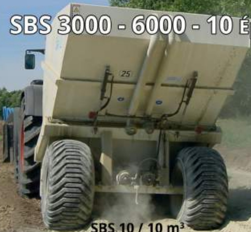
SBS 10 / 10 m 3