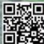
Vidéo SBV 80 HC 2