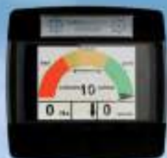
Boitier de commande de gestion du compactage