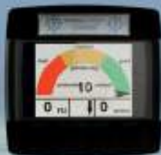
Boitier de commande de gestion du compactage