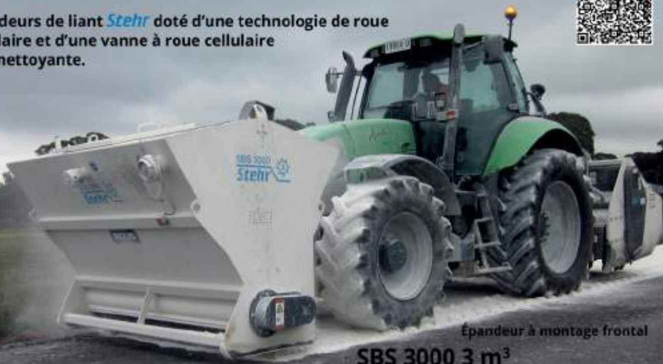
Épandeur à montage frontal

Épandeurs de liant Stehr doté d'une technologie de roue cellulaire et d'une vanne à roue cellulaire autonettoyante.