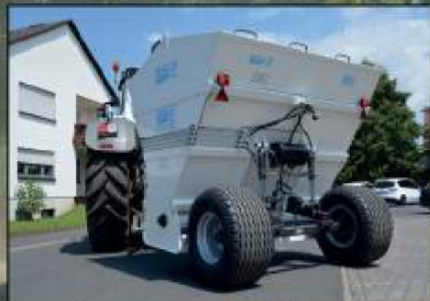
SBS 6000 / 6 m 3