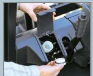
Bei zu geringem Bremsölstand leuchtet eine Lampe im Display auf