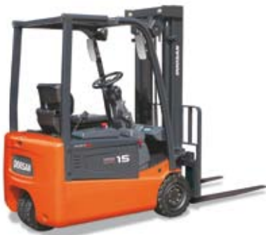
B15T / B18T / B20T - 5 Tragkraft 1.500 – 2000 kg, 3- Rad