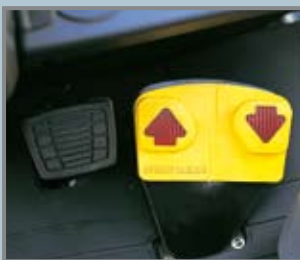
Mono-Pedal, für einen schnellen Richtungswechsel

Durch neu verlegte Hydraulikschläuche ergibt sich eine verbesserte Durchsicht gegenüber dem alten Mast um ca. 15%