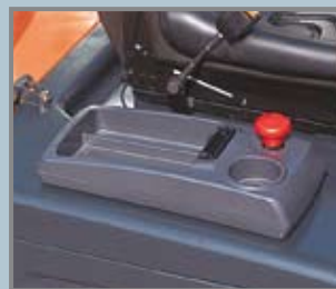
Papierhalter und Ablagefach für zusätzlichen Komfort.