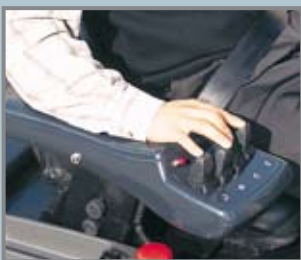
Finger- Tip Hydrauliksteuerventil (3-fach,4-fach)

sind einfach und ohne Werkzeug zu entfernen.