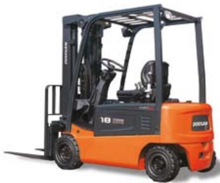
B16X / B18X / B20X - 5 Tragkraft 1.600 – 2000 kg, 4- Rad