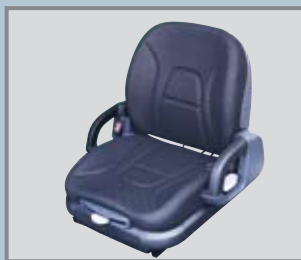
Sitz mit verstellbarem Sicherheitsgurt